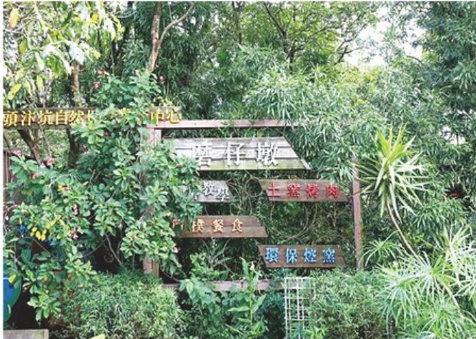
左：磨仔墩故事島生態農場外觀。

台中大坑九號與十號步道的入口處，自2016年起，除了迴盪山谷間沁人心脾的山嵐外，更瀰漫著一陣迷人的柴燒香味。循香信步，小瓢蟲柴燒窯烤候忽映入眼簾。其延續同在台中的磨仔墩故事島「自然、生態、環保、教育」的經營理念，廣設生態導覽、窯燒披薩DIY課程，成為親子共遊的熱門景點。