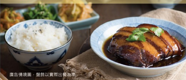
廣告情境圖，盤飾以實際出餐為準